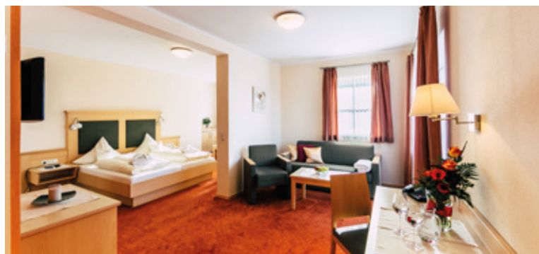
SUITE MÜHLRIEGEL ca. 40 m 2 , max. 4 Personen

Großes Doppelzimmer im Haupthaus mit Dusche und WC, Haarföhn, Kosmetikspiegel, Sat-TV, Safe, Kühlschrank, Sitz- ecke, Telefon, Radio, Balkon.