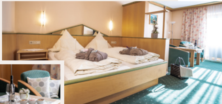
SUITE SILBERBERG ca. 35 m 2 , max. 4 Personen

Großzügige Suite im Haupt- haus, Dusche und WC ge- trennt, Sat-TV, Haarföhn, Safe, Telefon, Wohncke sowie Balkon, Kosmetikspiegel.