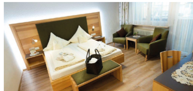
DOPPELZ. ENZIAN ca. 23 m 2 , max. 2 Personen

Suite mit Wohn- und Schlaf- bereich, Dusche und WC getrennt, Kosmetikspiegel, Haarföhn, Safe, Telefon, Wohncke, Kühlschrank und großem Panoramabalkon.