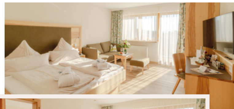
FAM. ZIMMER LUSEN ca. 50 m 2 , max. 5 Personen

Suite mit optisch abgetrenn- ten Wohn- und Schlafbereich, Badewanne/WC, separate Dusche, Haarföhn, Sat-TV, Safe, Telefon, Wohn- und Kuschel- ecke, Kühlschrank, Balkon mit Panoramaisicht über Bodenmais.