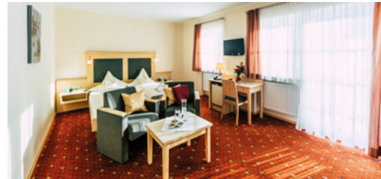
DOPPELZ. RIEDELSTEIN ca. 23 m 2 , max. 2 Personen

Großzügige Suite im Haupt- haus, Dusche und WC ge- trennt, Sat-TV, Haarföhn, Safe, Telefon, Wohncke sowie Balkon, Kosmetikspiegel.